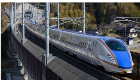
北陸新幹線車両W7系